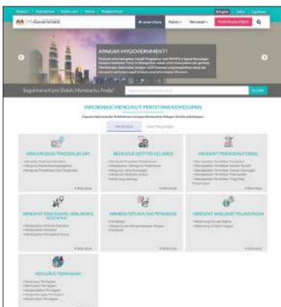
01 Laman utama portal MyGovernment 2.0

Rekabentuk portal MyGovernment 2.0 telah ditambahbaik dari segi rekabentuk dan ikon yang baharu pada laman utama, laman kedua dan laman kandungan portal.