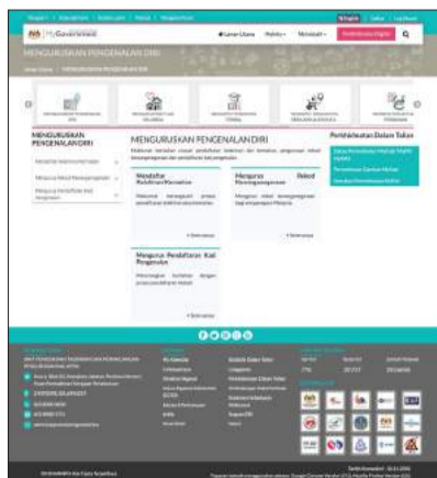
02 Halaman kedua portal.